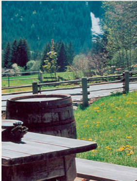
Ihr Frühstückstisch mit einem herrlichen und direkten Blick zu den höchsten Wasserfällen Europas.